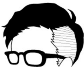
株式会社アザナ 代表取締役社長 田邊 裕貴